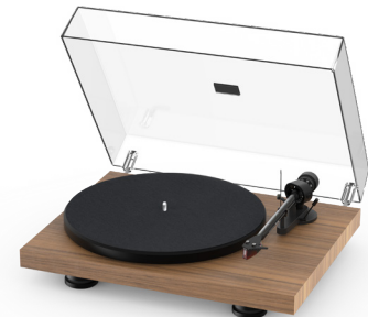
Satin Echtholz Walnuss Furnier